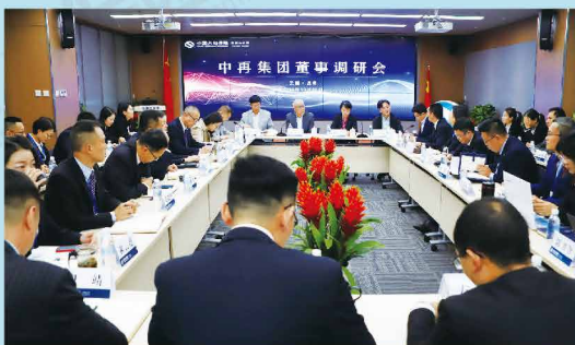
中再集团董事调研组一行赴大地保险云南分公司进行调研