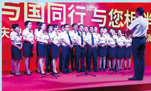
人保财险云南省分公司举办庆祝建国建司70周年文艺汇演