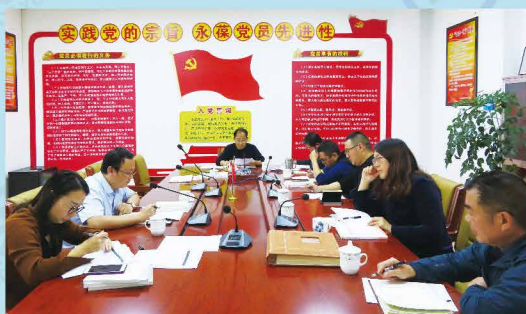
曲靖市保险行业协会联合党支部召开对照党章党规找差距专题会议