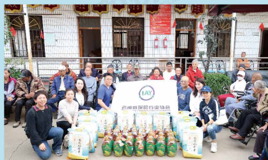
云南省保险行业协会开展2019年“敬老月”活动