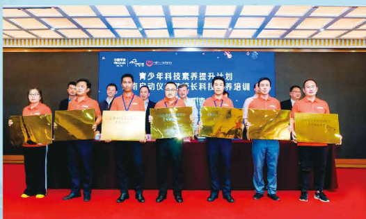
中国平安参与“青少年科技素养提升计划”助力云南教育扶贫