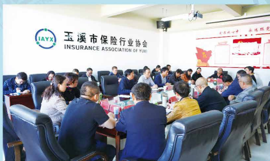
玉溪市保险行业协会召开2019年第七次车险自律工作会议