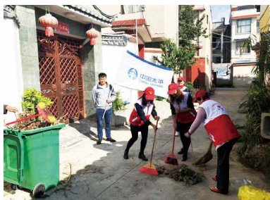
和谐的氛围中得到了广大群众的热