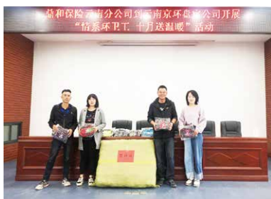
心用品，感谢并祝福每天奋战在工

作一线，为美化城市，改善人居环境做出巨大贡献的“马路天使”和“城市美容师”节日快乐！