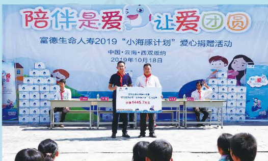
富德生命人寿“小海豚计划”云南站爱心公益活动走进西双版纳曼典小学