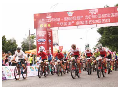
“七彩云南·运动德宏”2019

体育文化旅游节“平安杯”山地自行车挑战赛于10月3日在芒市开赛，来自全国的238名选手参加角逐。本次赛道为山地运动赛道，选手们从孔雀湖环湖观光道出发，经大金塔、银塔，穿过密林，抵达终点。比赛中虽突降大雨，使得赛道泥泞不堪，湿滑危险，但各位车手们仍然勇往直前，意气风发。