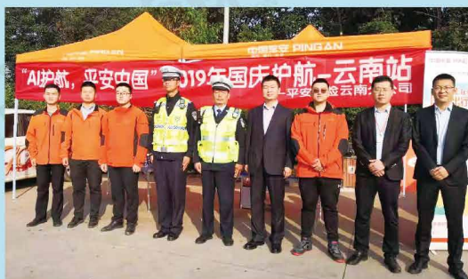
云保协全力护航国庆长假保险车辆快处快赔服务工作