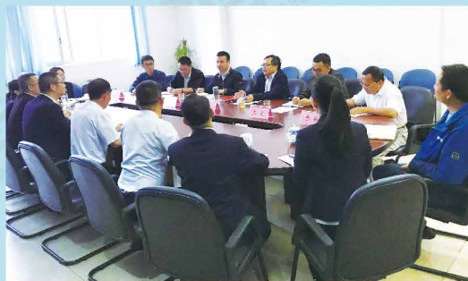
楚雄银保监局赴太平洋产险楚雄中心支公司调研