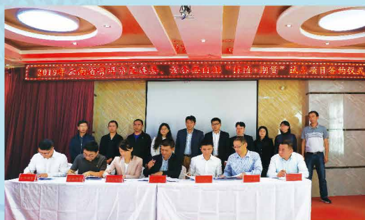
太平洋产险云南分公司全面启动普洱市白糖“保险+期货”试点项目