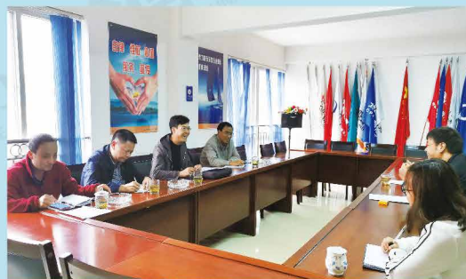
楚雄银保监分局对楚雄州保险行业协会“小金库”专项治理工作进行督导