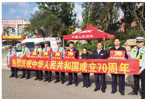
人保财险云南省公司

岗位上，奋战在高速公路路口边，车流密集处，客户需要的地方。一顶红帐篷，两张木桌子，几个简易的凳子，就是他们办公场所，风吹日晒，没有热腾腾的饭菜，只有过往的车辆，但他们无怨无悔，用真诚、热心、周到的服务，为假日出行的客户保驾护航。