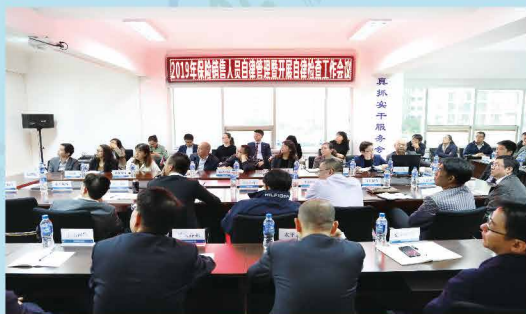
云保协召开加强销售人员自律管理、加大数据信息运用工作会议