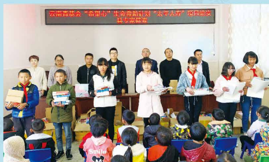
“心系姚安 共享太平”太平手拉手公益走进姚安