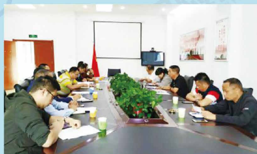
保山协会组织召开加强机动车辆保险自律工作会议