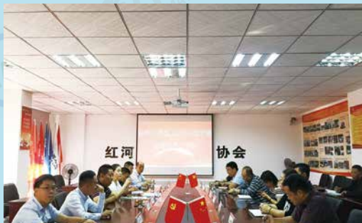
红河州保险红河州保险业进一步整治车险市场