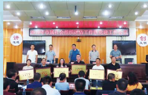
曲靖市保险行业协会公益、党建再获殊荣