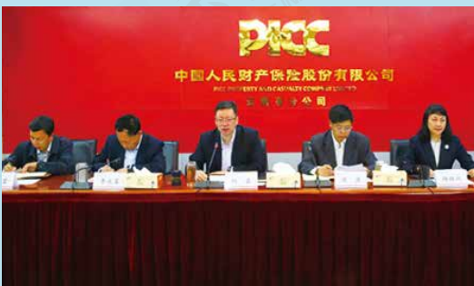
人保财险云南省分公司召开全省保险工作会议