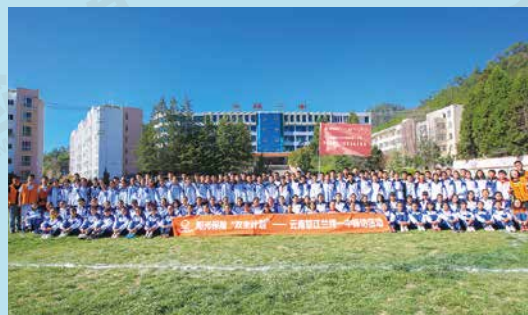
阳光保险志愿者探访云南怒江兰坪一中