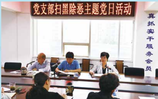
中共云南省保险行业协会保险学会联合党支部开展“扫黑除恶”专项斗争主题党日活动