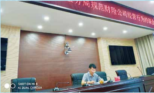
德宏银保监局召开规范财险公司经营行为约谈会