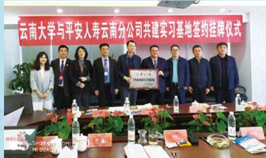
平安人寿与云南大学共建实习基地