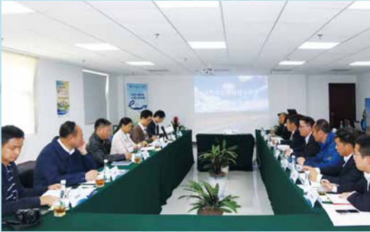
中国银保监会莅临太平洋产险曲靖中支调研农险工作