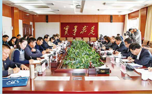
中国人寿财险云南分公司 联合迪庆州政府召开保险助推脱贫攻坚会