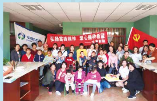
太平财险云南分公司开展弘扬雷锋精神系列活动