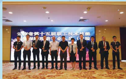
云南省保险行业协会隆重举行第十五届职工技术技能大赛保险理赔专业人员(产险理赔)技术能手表彰会