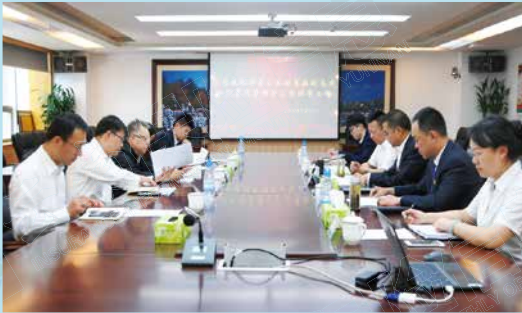
中国人寿集团公司副总裁到昆明分公司调研指导工作