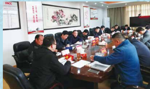
昭通保险行业协会召开进一步规范车险市场会议