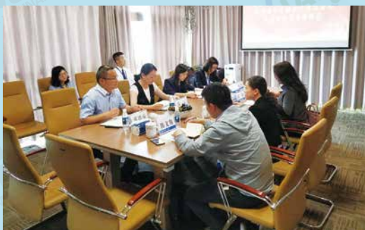
中国大地保险云南分公司完成“车险缴费实名制认证”现场验收