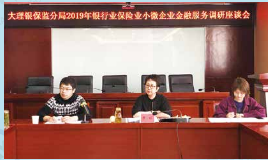
大理银保监局召开小微企业金融服务调研座谈会