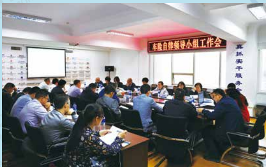
云保协牵头拟定车险自律检查规则等多个行业规范性文件